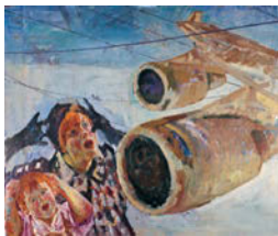
Nine Eleven , 2005 Acrylique sur papier, marouflé sur masonite 215 x 252 cm Collection Würth, Inv. 14618