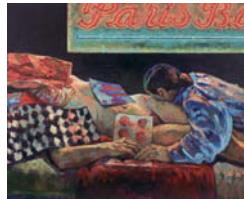
Paris Bar , 2001 Acrylique sur isorel 193 x 239 cm Collection privée