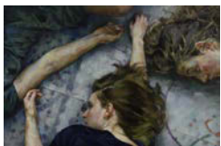
Crime Map , 2010 Huile sur Dibond 113 x 168 cm