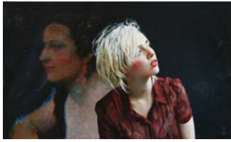
Kuhaugen und Schubladen , 2008 Yeux de vache et tiroirs Technique mixte sur Dibond 120 x 199 cm Collection privée