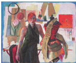
Ballet Russe , 2000 Acrylique sur isorel 202 x 250 cm Collection Würth, Inv. 7769

Login : pressemwfe - Mot de passe : hausner