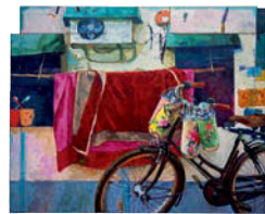
Hotel Shanghai , 2010 Acrylique sur isorel 254 x 294 cm