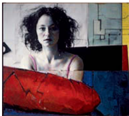
In Flagranti , 2003 Flagrant délit Photo, acrylique, papier, collage sur Alucobond 175 x 196 cm Collection Würth, Inv. 7771